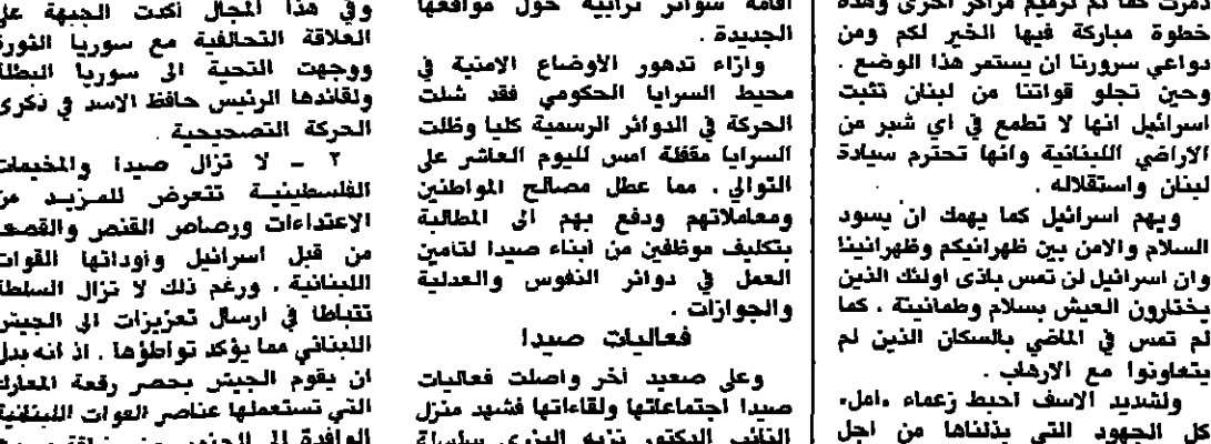
جنود مندسة يتخفون على المواقع